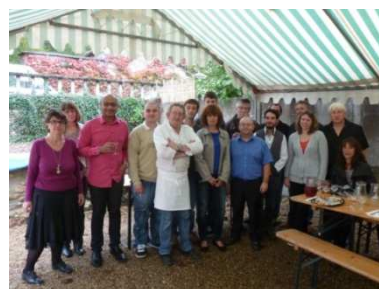
Merci à toute l'équipe des bénévoles